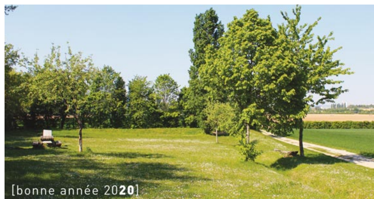
[bonne année 2020]